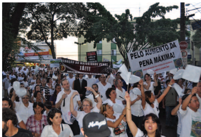
PASSEATA PELA PAZ, SÃO BERNARDO DO CAMPO

O SOESP acompanhará de perto todo o processo para que seja feita justiça, a violência em nosso país alcança níveis alarmantes, segundo a Secretaria de Segurança Pública do Estado foram registrados no primeiro trimestre deste ano 1.189 homicídios dolosos, destes, 403 ocorreram em Março. Os trabalhadores não podem mais ficar reféns de marginais que agem com a certeza da impunidade.