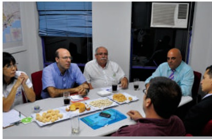
Reunião com representantes de sindicatos de profissionais liberais, no SOESP.

O SOESP se uniu a outros sindicatos de profissionais liberais na luta contra o projeto de lei 3.507/2008 (apenso o PL 6.463/2009), proposto pelos Conselhos, que prevê o aumento do valor das anuidades.