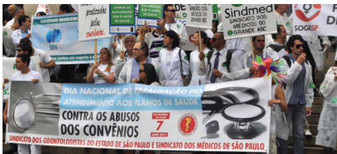
Manifestação realizada no dia 7 de abril, na Praça da Sé, em São Paulo.

O Dia Mundial da Saúde, celebrado no dia 7 de abril, foi marcado por reivindicações em todo o País. Cirurgiões-dentistas e médicos e se uniram para protestar contra o valor repassado pelas operadoras de planos de saúde.