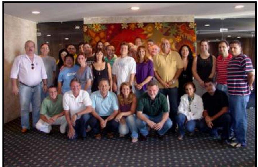
Foto de encerramento do evento e seus participantes

instituições federais: congresso nacional, executivo federal e ministério da saúde, influenciando e conquistando benefícios importantes para o cirurgião dentista. Nossa união se dá principalmente pela preocupação em construir uma sociedade equilibrada e mais justa para o Brasil.